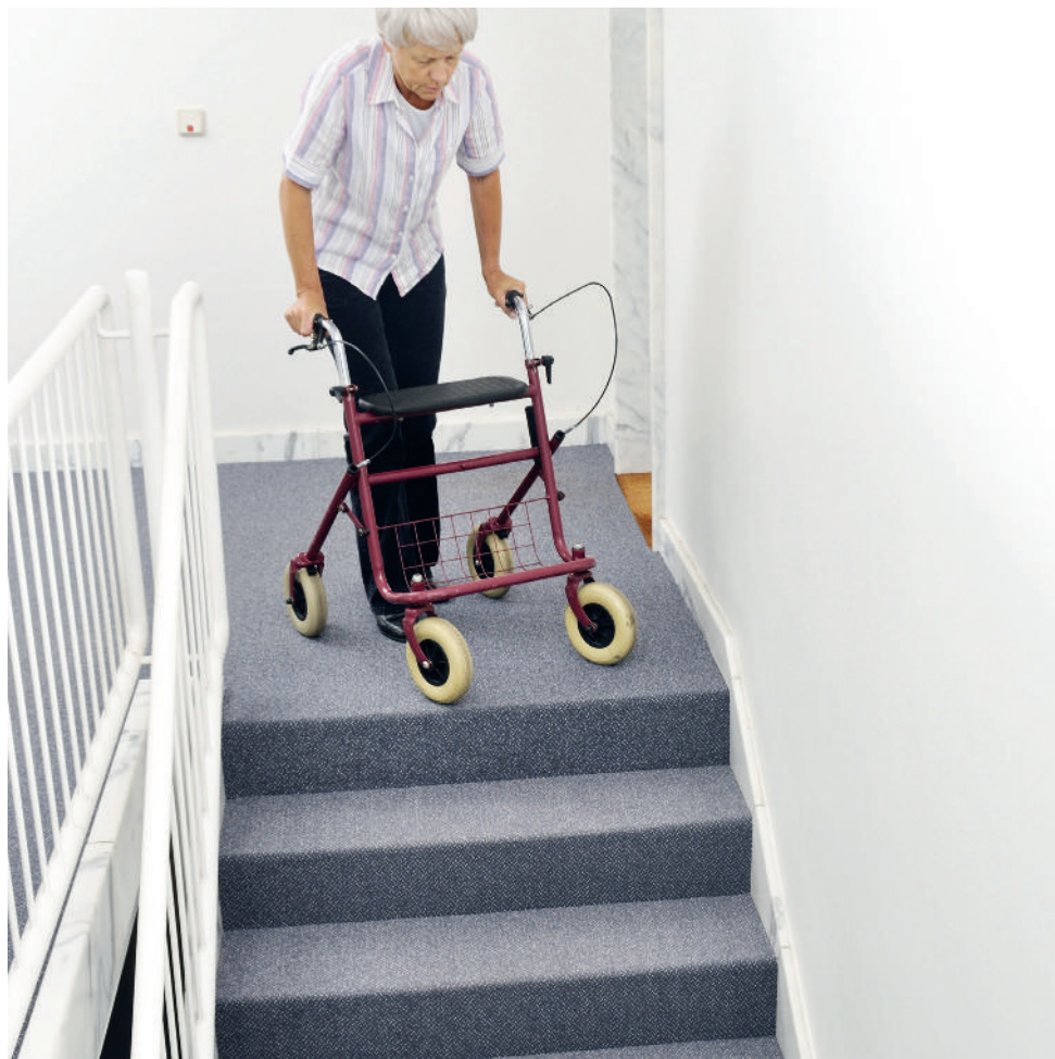
Barrieren wie Treppen, Stufen und Schwellen erschweren den Alltag.